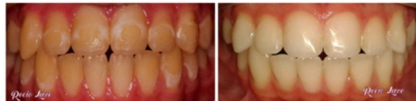
Microabrasión - Remineralización